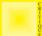
Illustration de couverture : https://www.helmholtz-berlin.de/media/media/spezial/people/banhart/html/D-Others/open/article/d034_manke2008.pdf